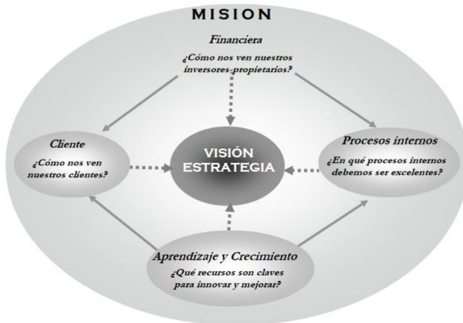
Figura 1: Las cuatro perspectivas del mapa estratégico.

Un mapa estratégico se desarrolla a través del modelo de CMI de cuatro perspectivas.